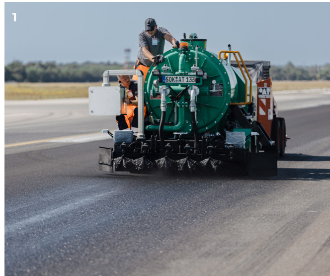
1 Onyxauftrag | 2 digitale Einstellung der Auftragsmenge | 3 eshabit Onyx Primer als Haftgrund